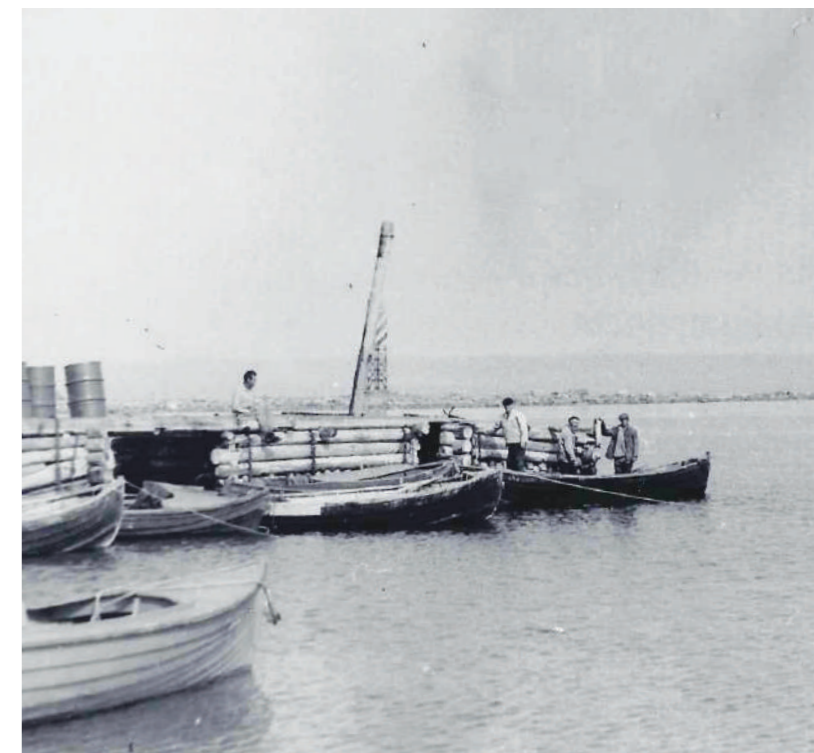
↑ Причал с воротом.