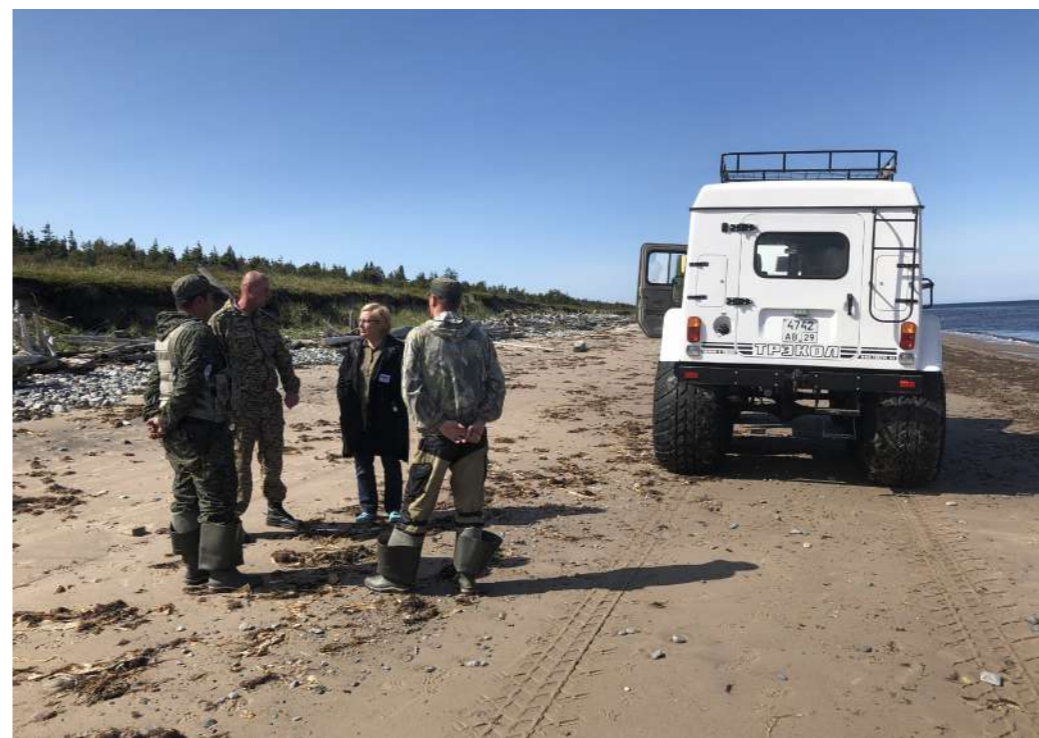
↑ Встреча с оперативной группой.

Онежское Поморье подарило мне незабываемые встречи и знакомства с талантливыми и трудолюбивыми жителями, бесконечно любящими свою землю. Жить на краю земли, в оторванности от мира, между лесом и морем, между небом и землей могут только самодостаточные люди. А моим любимым местом стала деревня Летний Наволок.