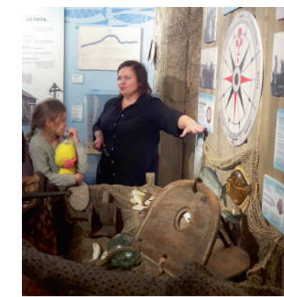
↑ Музей «Дом на восьми ветрах».