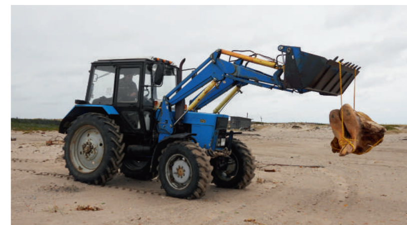
→ Транспортировка скелета.