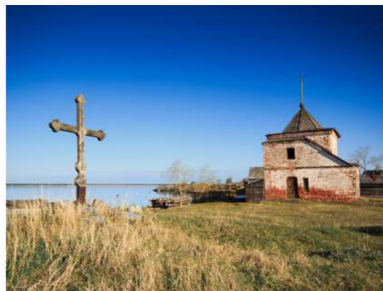
← Петр Первый и Лефорт в Пертоминске.