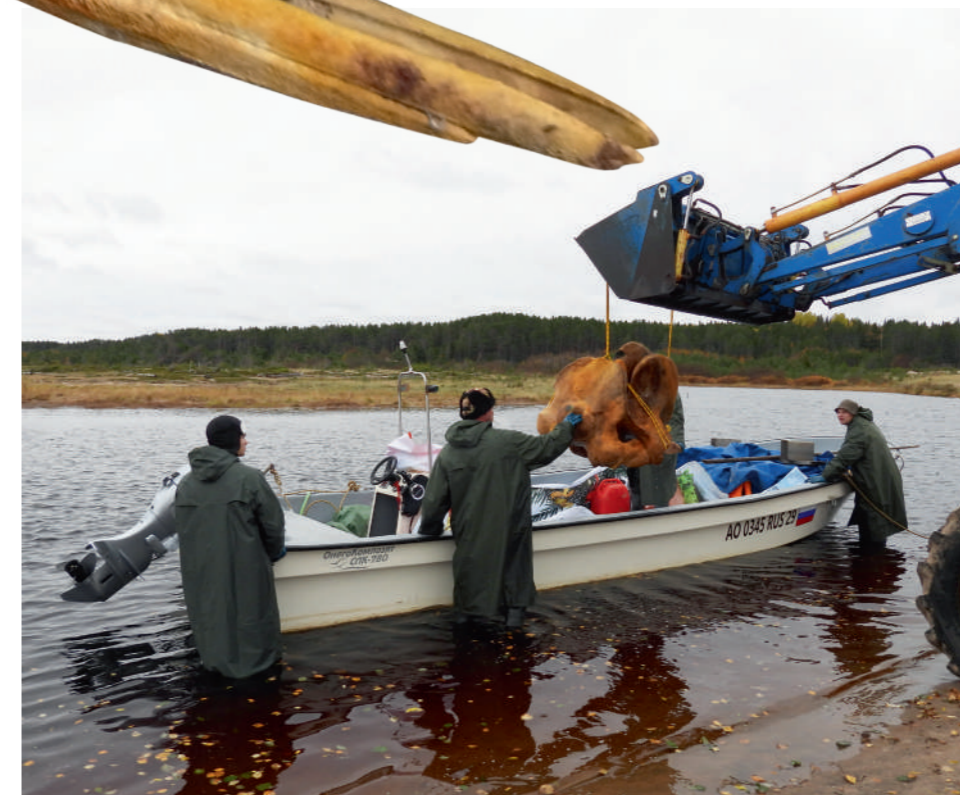
← Транспортировка скелета.

Скелет бутылконоса есть лишь в нескольких музеях мира. Один из них можно увидеть в Зоологическом музее Российской академии наук Санкт-Петербурга. В Лондоне такой экспонат появился в Музее естествознания после того, как в сентябре 2006 года молодой пятиметровый бутылконос поплыл вверх по течению Темзы. Возможно, кит попал в пресные воды, устремившись за баржей. На следующий день животное погибло.