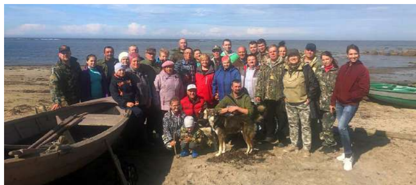
↑ День рыбака в Летнем Наволоке.

На Русском Севере территории живые, и они сами определяют, кого пустить, а кого — нет. Так же, как и северяне: далеко не каждого к себе подпустят