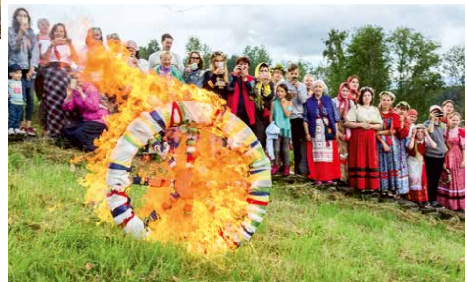
Спуск огненного колеса.

Ярким продолжением Фестиваля Традиционных знаний в Кенозерье стал Иванов день. Праздник, возрождённый местными жителями, проходит на Масельге уже седьмой год