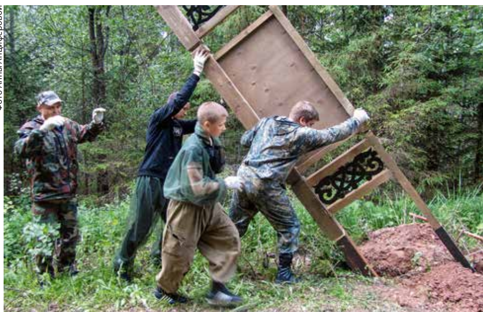
Работы по обустройству маршрута «Тропа предков»