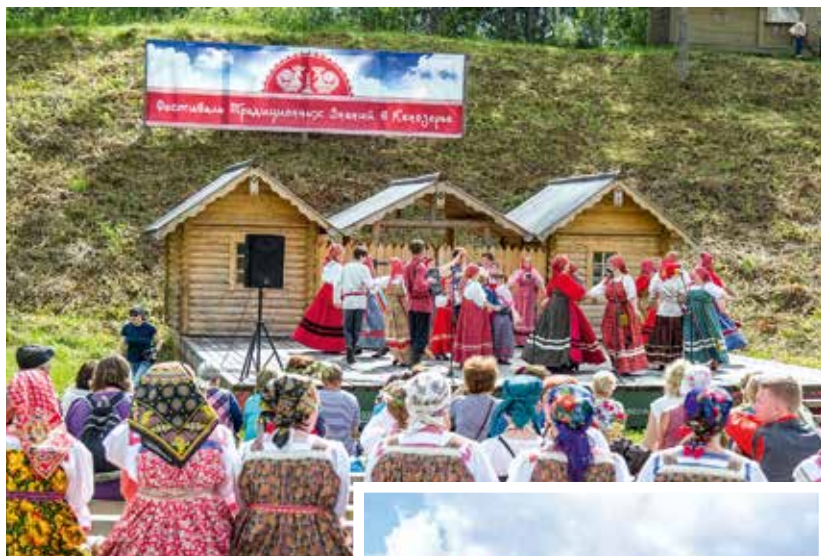
Гала-концерт на Иванов день.

Старинная Масельга созвала друзей на масштабное событие лета в Кенозерье — Фестиваль Традиционных Знаний. Пятый, юбилейный фестиваль собрал участников из Москвы, Вологды, Санкт-Петербурга, Архангельска, Петрозаводска, Каргопольского, Плесецкого, Холмогорского, Онежского районов и впервые из деревень Онежского полуострова.