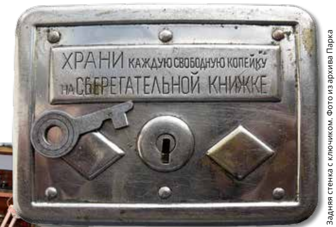
Задняя стенка с ключиком.