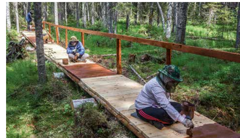
Работа волонтеров на экологической тропе

В Кенозерском национальном парке в этом году пройдет восемь волонтерских смен, кроме того, добровольцы уже провели ряд субботников, помогли в ремонтных работах, выступили в роли вожатых детских отрядов на «Театральной смене Экологического лагеря Кенозерья» и приняли участие в орга-