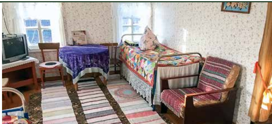
Сельский гостевой дом.

Безусловно, максимально мощную консультационную, информационно-образовательную поддержку активные жители получают от Парка. «Зимние встречи», «Фестиваль традиционных знаний», стратегические сессии, тематические семинары — это регулярные площадки, где люди обучаются ремёслам, осваивают бизнес-опыт, учатся планировать и реализовывать идеи, знакомятся с