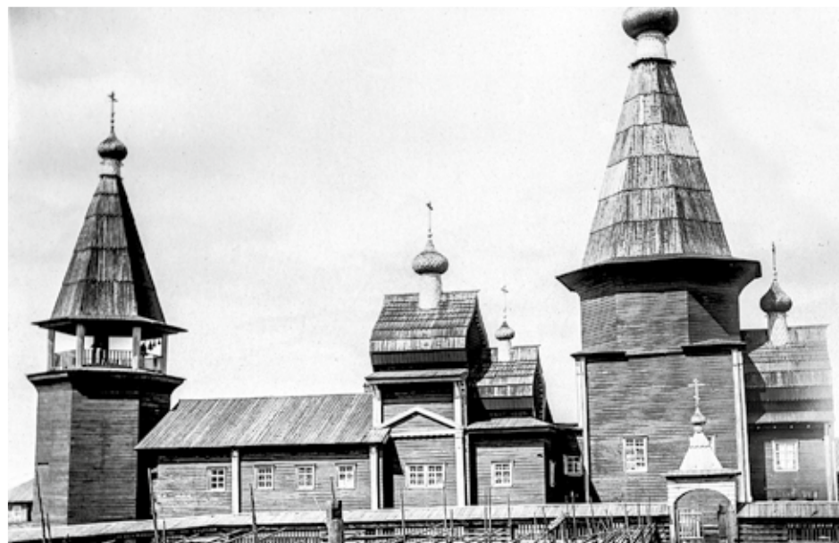
Почезерский погост, 1903 год

Почезерский ансамбль выделяется чрезвычайно редкой в русском деревянном зодчестве диагональной объёмно-пространственной композицией, аналогов которой в России не сохранилось