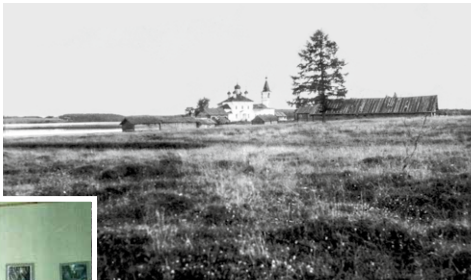
Успенская церковь, 1950-е гг.

В деревне Погост издавна располагался центр обширного Кенозерского прихода, возникшего в середине XVI века