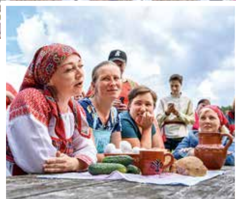
Фольклорный проект «Народная драма»

более 130 участников фестиваля стали большой и дружной семьёй.