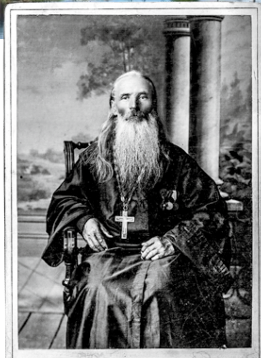
Неизвестный кенозерский священник.

Все дети братьев священников какое-то время занимали церковные должности в Кенозерском приходе. Трём из