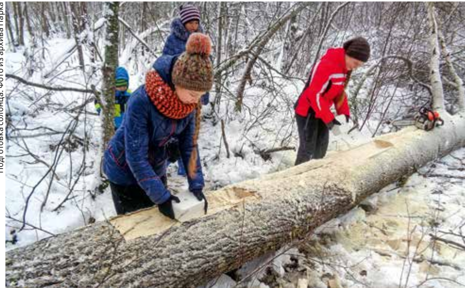
Подготовка солонца. Фото из архива Парка