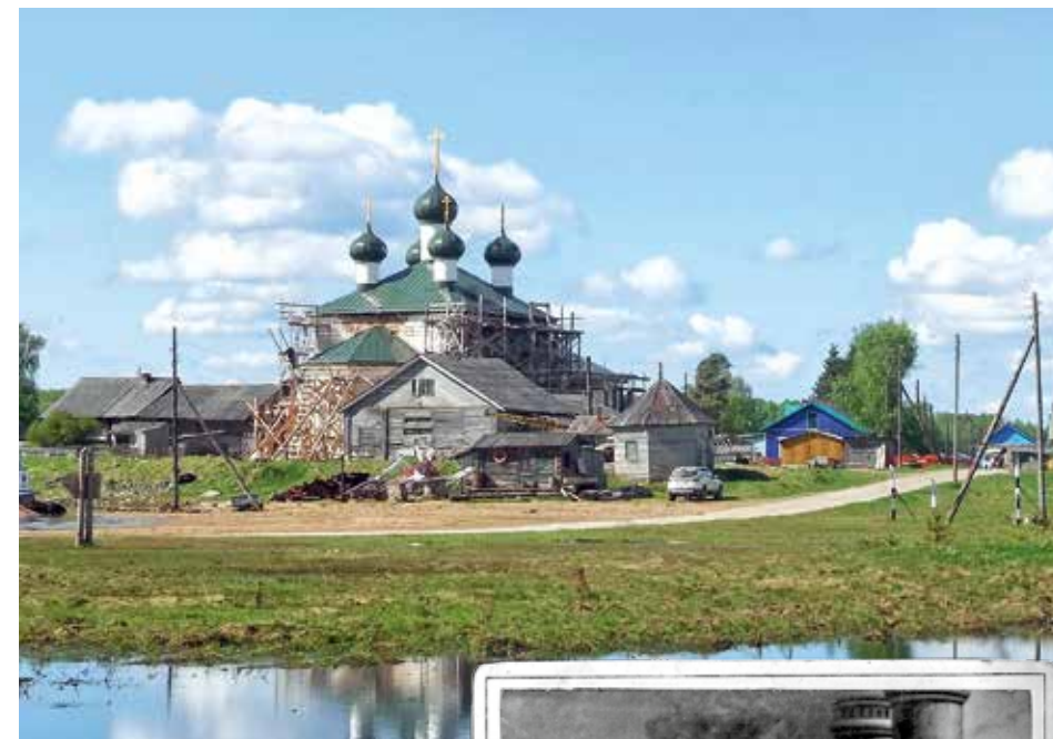
Успенская церковь. 2018 г.

В церкви Успения Божии Матери деревни Вершинино завершены реставрационные работы по перекрытию кровель храмовой части, трапезной и алтаря. Восстановлены главы с барабанами и крестами. Предстоит ещё огромный объём работ по воссозданию конструкции колокольни, укреплению фундаментов и стен, восстановлению внутреннего убранства.