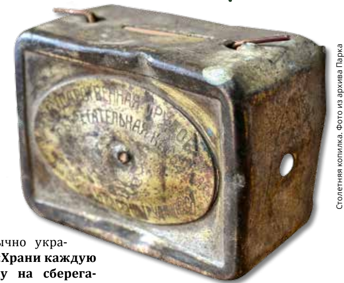
Столетняя копилка.

Сейчас эта копилка находится на реставрации, затем станет экспонатом новой экспозиции «Кенозерье. Хроники памятного и обыкновенного», которая в скором времени будет знакомить жителей и гостей с историей Кенозерья в XX веке в здании Визит-центра Парка в деревне Вершинино. ■