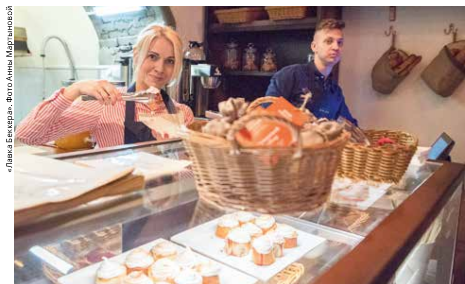
«Лавка Беккера». Фото Анны Мартыновой

В Ночь Музеев состоялось ещё одно долгожданное событие — открытие в Архангельске новой пекарни «Лавка Беккера», созданной совместными силами Кенозерского национального парка и ресторана «Почтовая контора 1786 г.». Гуляя по Набережной Северной Двины и наслаждаясь пейзажами Архангельска, Вы можете приятно дополнить свою прогулку ароматным кофе с невероятно вкусными булочками, а также приобрести сувениры, сделанные руками Кенозерских мастериц и мастеров, которые несут в себе деревенское тепло Вам и в Ваш дом. Обстановка и уют в данном заведении никого не оставят равнодушным и заставят возвращаться туда вновь и вновь!