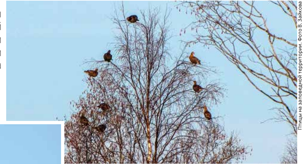
Птицы на заповедной территории.

Проведённые учёты продолжают многолетний мониторинг численности зверей на территории национального парка