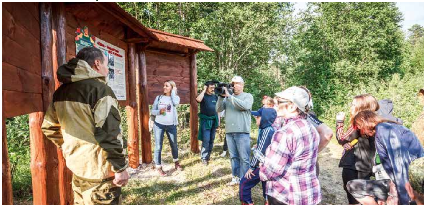
Экскурсия по экологической тропе.