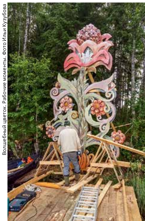
Волшебный цветок. Рабочие моменты.

В июле в Каргопольском секторе Кенозерского национального парка стартовал масштабный проект по строительству арт-объектов на экологической тропе «Система пяти озёр». В основе идеи — обновление визуального пространства водно-пешеходного туристического маршрута «Система пяти озёр», ведущего к первой в России восстановленной действующей водяной мельнице.