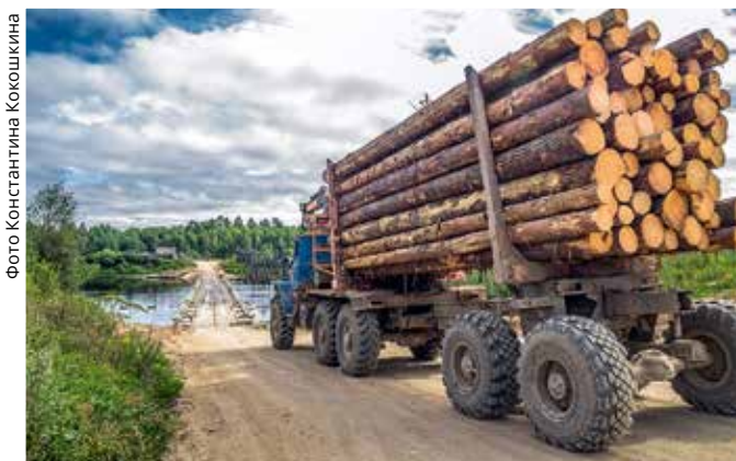
Площади лесов вокруг Кенозерского национального парка сокращаются