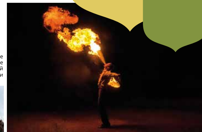
Огненное завершение Успенской ярмарки

ничным костром — «Успенским огником». Зажгли его во время своего выступления участники театра огня и света «Intra Solis». Их «огненное» выступление на живописном берегу Кенозера не оставило многочисленную публику равнодушной и стало отличным завершением яркого дня. ■