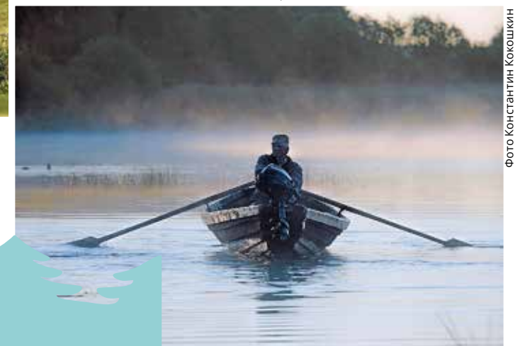
Рыбак на туманном Лекшмоозере

«Вопрос подготовки документации находится на постоянном контроле у Министерства культуры РФ. План управления объектом наследия, находящийся сейчас в стадии актуализации, разработан совместно с Российским научно-исследовательским институтом культурного и природного наследия имени Д.С. Лихачёва.