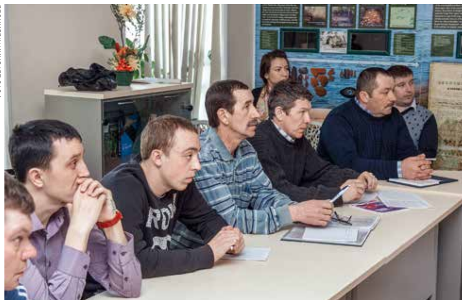
Сотрудники НП «Онежское Поморье» на учёбе