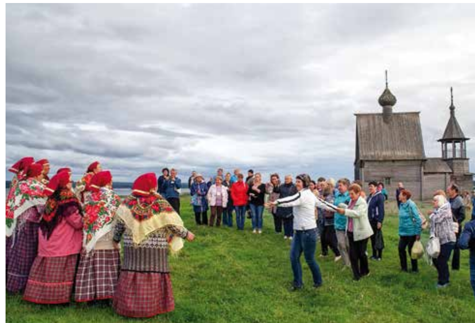
«Зазнобушки» с гостями Парка.

Большим событием в творческой жизни «Любо-дорого» стала поездка в сентябре этого года в Словакию на фольклорный фестиваль «Территория вдохновения» в деревне Гановце, где мы успешно презентовали традиционный северный фольклор на «полях» южнославянских традиций.