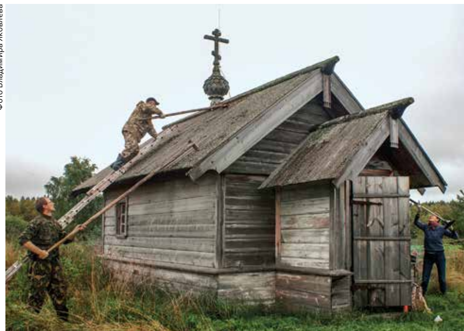
В «Часовенном раю»