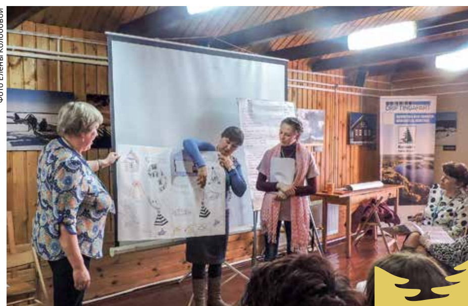
Защита своей инициативы в рамках семинара «10 шагов к успешному проекту» жителями Пушлахты

месяцами не выплачивались пенсии и зарплаты, и дети в дни каникул ходили в школу, потому что им наливали горячий чай без сахара, учителя со школьниками Лекшмозерской школы Каргопольского сектора Кенозерского национального парка поставили спектакль по рассказу В.М. Шукшина «До третьих петухов». Этот спектакль на сцене старого холодного клуба смотрела ВСЯ деревня — от младенцев до глубоких стариков. И это единение «актёров» и зрителей заставило меня поверить в то, что выживет, не умрёт деревня, не уронит чувство собственного достоинства в то время, когда, казалось, нет никаких перспектив ни для себя, ни для своей деревни, и чувство отчаяния отступало. Это было одно из самых сильных моих потрясений.