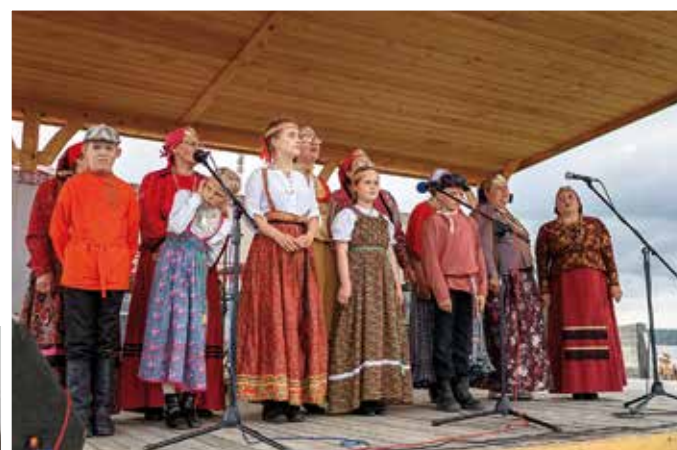
Выступление фольклорного коллектива «Кенозёрочка»