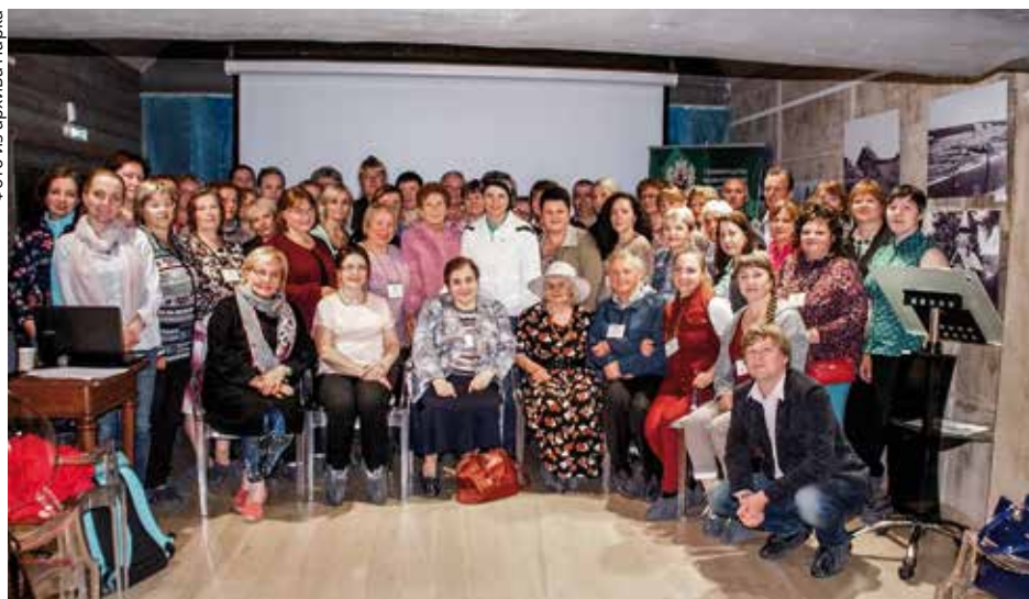
Участники Фестиваля в конференц-зале музея «В Начале было Слово»