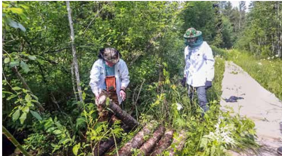
Добровольцы на обустройстве «Тропы старца Кирилла».

«Узнав о лагере, я сразу же решила принять в нём участие. Прикоснуться к деревянному зодчеству Русского Севера, пожить на берегу того самого Кенозера — пути древнего волока, увидеть своими глазами культурные и природные ландшафты Парка — такое нельзя было упустить. Спасибо Парку за предоставленную возможность и чёткую организацию работы. Отдельная благодарность нашему