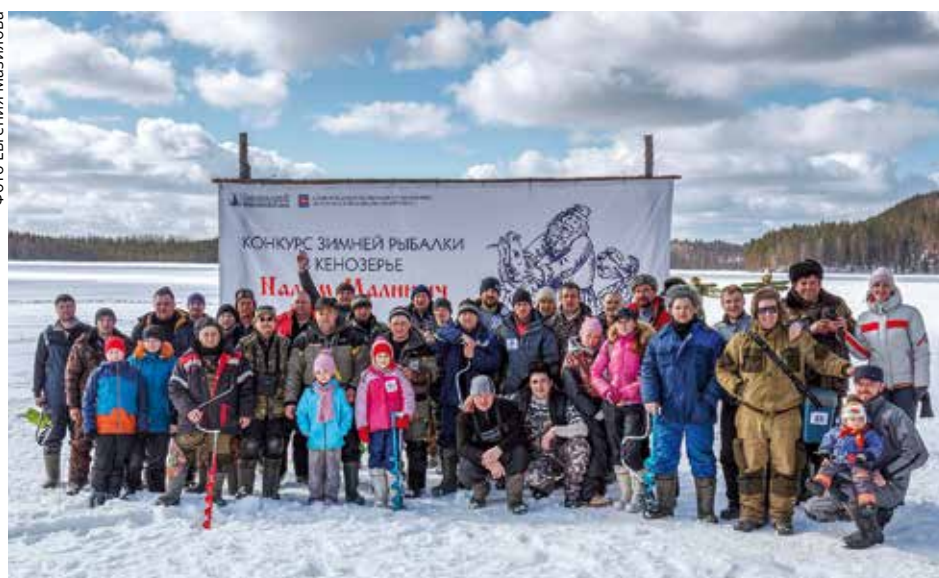
Участники конкурса зимней рыбалки «Налим Малиныч»

В этом году «Налим Малиныч» стал семейным праздником и переместился с берегов Лекшмозера в Масельгу