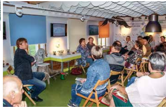
фото из архива Парка