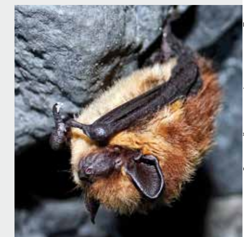
Северный кожанок.

два последних вида ранее на территории Кенозерья не встречались. Северную часть Парка облюбовали северный кожанок, рыжая вечерница, водяная и прудовая ночницы. Кроме того, там поселился бурый ушан, внесённый в Красную книгу Архангельской области. ■