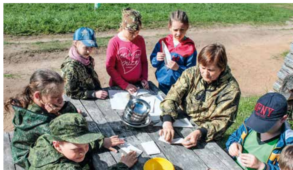
Обработка результатов полевых работ участниками ГЕОсмены

Опять же в июле прошёл ежегодный экологический лагерь Кенозерья «ЭЛК-2017». Почти 70 школьников из Архангельской области, Москвы, Санкт-Петербурга и Тулы под руководством 16 экспертов и вожатых искали в природе источник для вдохновения и творчества, изучали природу и животный мир