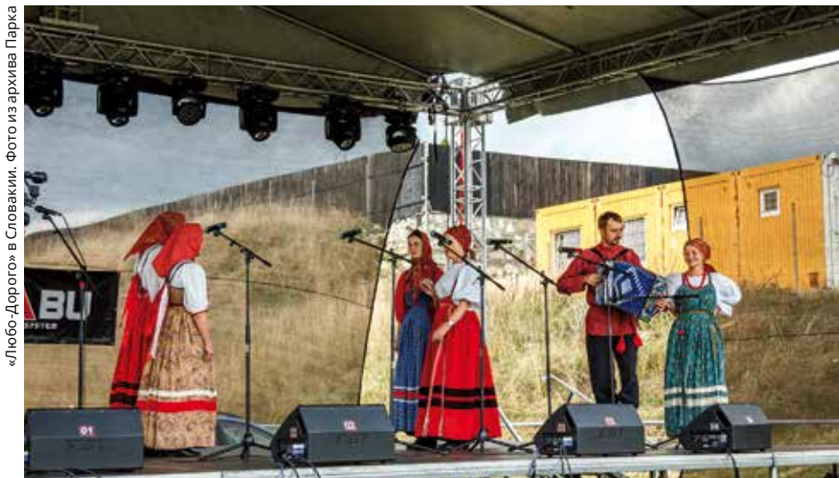
«Любо-Дорого» в Словакии.

Юные участники фольклорных коллективов Парка. Культура и традиции передаются из поколения в поколение