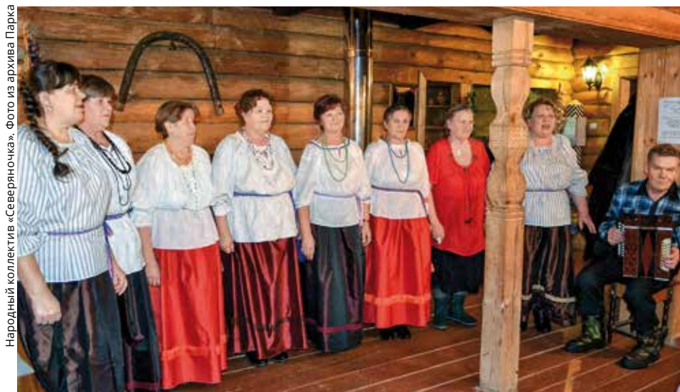
Народный коллектив «Северяночка».