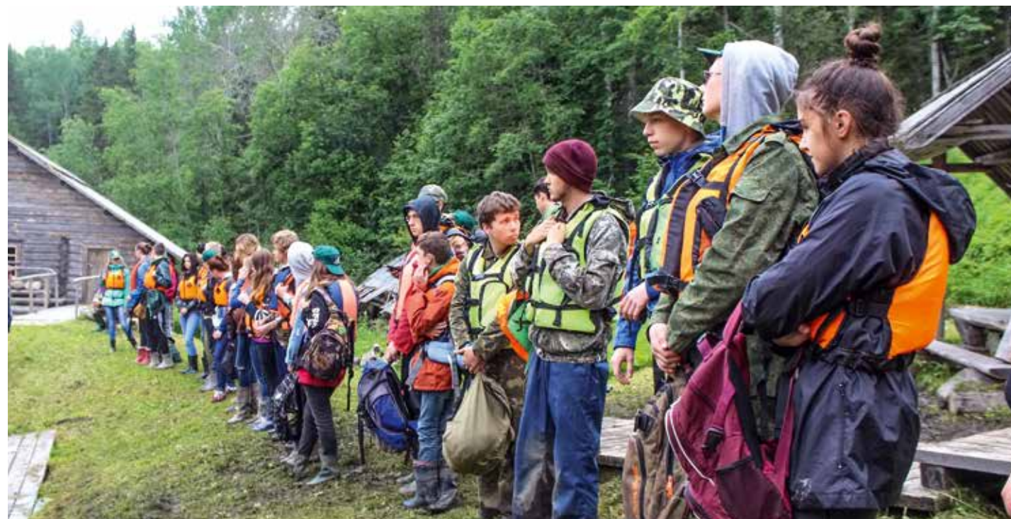
Участники ЭЛК — 2017.