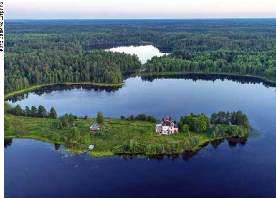
Макарьевская Хергозерская пустынь, 2015 год