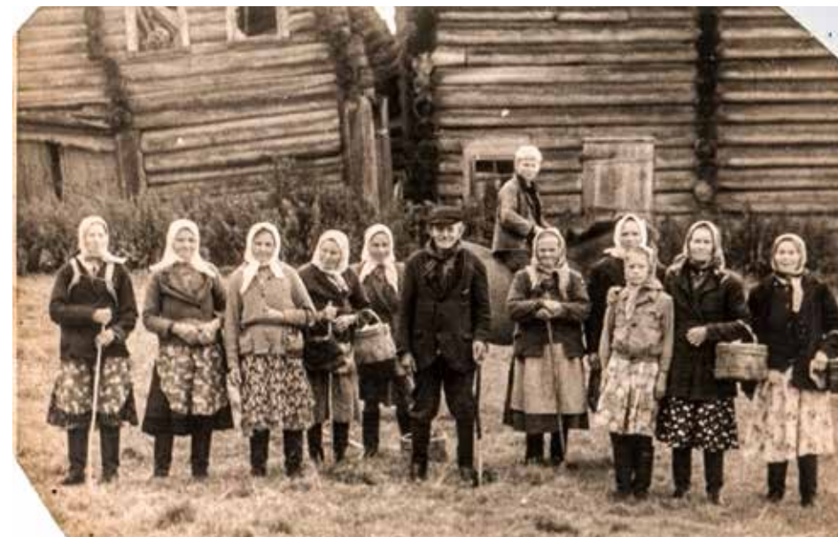
1960-е годы