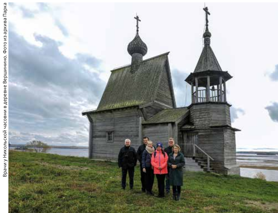
Врачи у Никольской часовни в деревне Вершинино.

Кенозерский национальный парк совместно с Министерством здравоохранения Архангельской области продолжает реализацию проекта «Заповедное Кенозерье — территория здоровья». В этот раз мобильная бригада врачей Архангельской областной клинической больницы принимала пациентов в Плесецком секторе Парка с 10 по 13 октября.