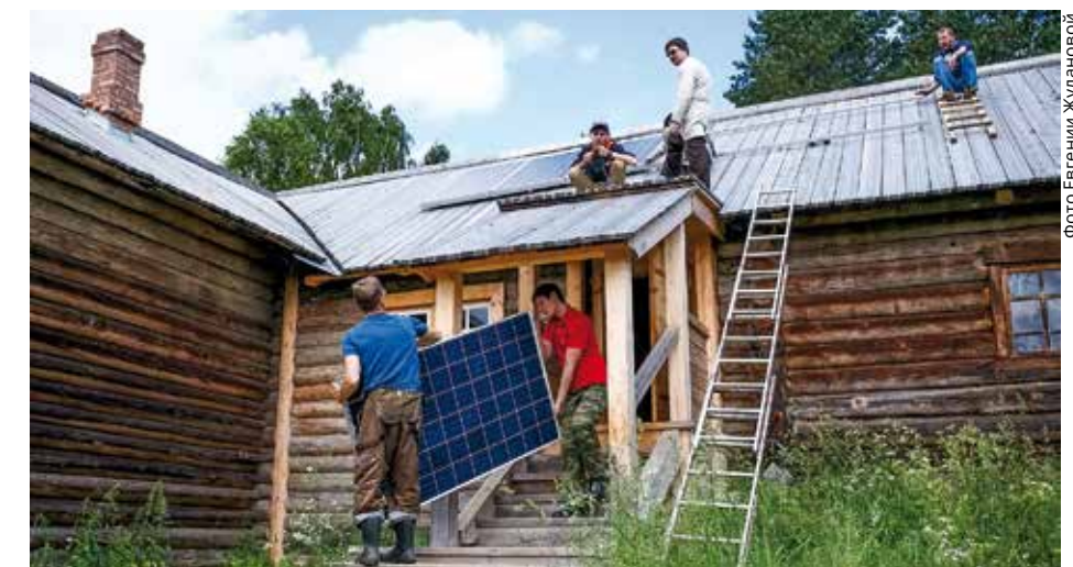
В летней школе приняли участие более 50 человек из четырёх стран

Организаторами Климатической школы выступили Архангельская молодежная общественная организация «Этас» совместно с ClimateActionNetworkInternational, при поддержке ФГБУ «Национальный парк «Кенозерский», ООО «Чистые технологии Балтики», Норвежского Баренцева секретариата и Управления по делам молодёжи Архангельской области. ■