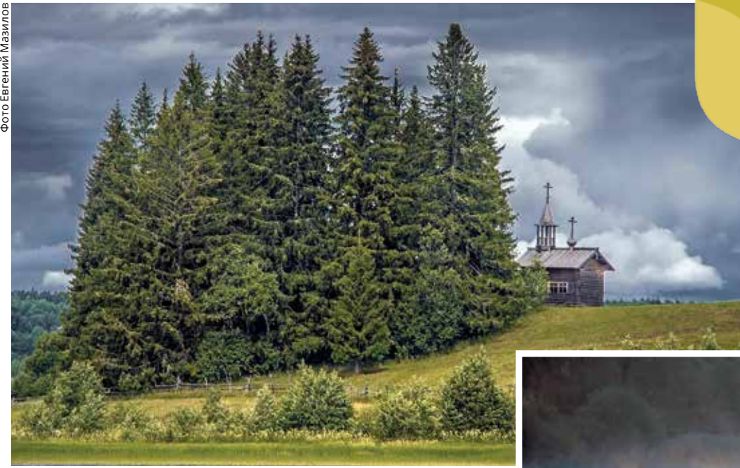
Святая роща и часовня Александра Невского в деревне Мыза

«Сейчас мы готовим документы по включению в список шести объектов наследия — это Гороховец (Владимирская область), кремль и в целом памятники древнего Пскова, Спасо-Преображенский собор Ярославля, Онежско-Беломорские петроглифы в Карелии, комплекс «Башкирский Урал» в Башкортостане и Кенозеро, известное всему миру, в Архангельской области. Большинство из этих объектов в Предварительный список ЮНЕСКО включено», — отметил Владимир Мединский.