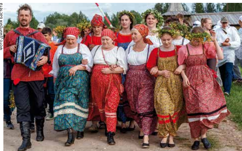
Громкое и яркое празднование Иванова дня